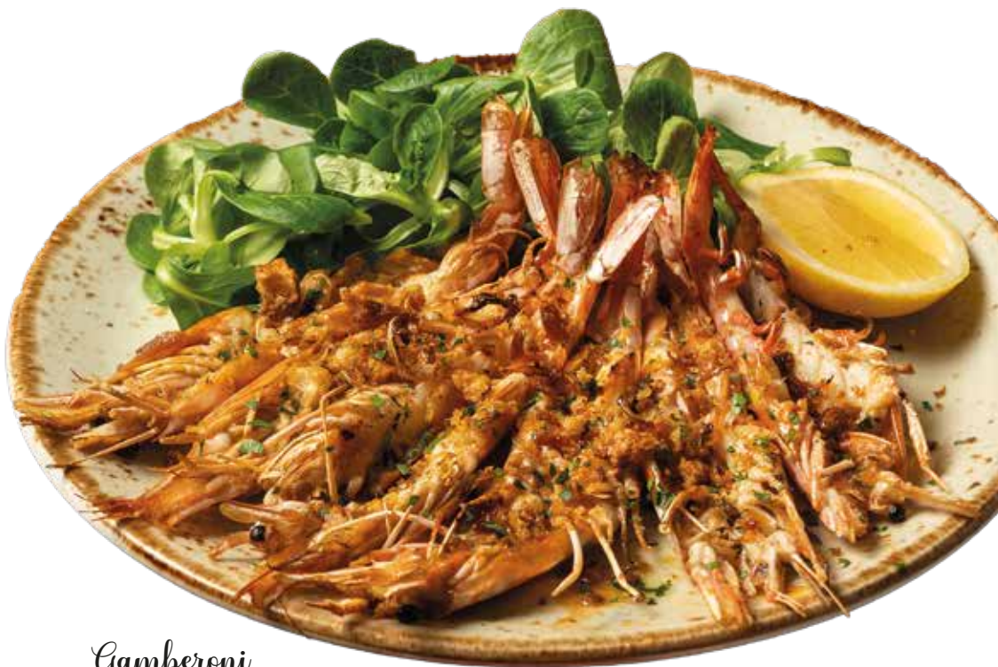
Gamberoni al forno ↗