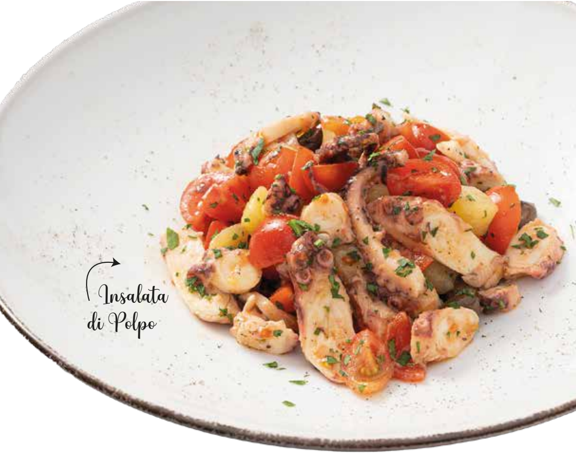
↪ Insalata di Polpo